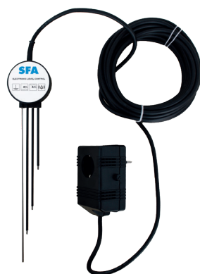
Elektronische Niveausteuerng optional für SANIPUDDLE (siehe S. 108)